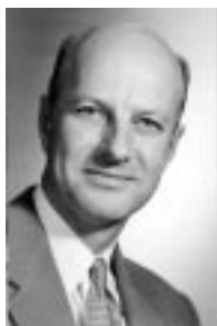
Kent helped launch under graduate math program.

Nous encourageons fortement les membres de la SMC et les abonnés de nos revues à nous faire part de leurs commentaires. Écrivez-nous par courriel à jcm@smc.math.ca ou bcm@smc.math.ca , ou communiquez directement avec la SMC (voir adresse de courriel ci-dessus).